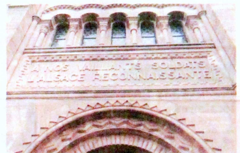
La dédicace au-dessus de l'entrée principale rend hommage aux milliers de soldats tombés sur le front en Alsace et dans les Vosges.

Journée du souvenir le dimanche 7 novembre. Messe célébrée à 10h30 en l'église de l'Emm.