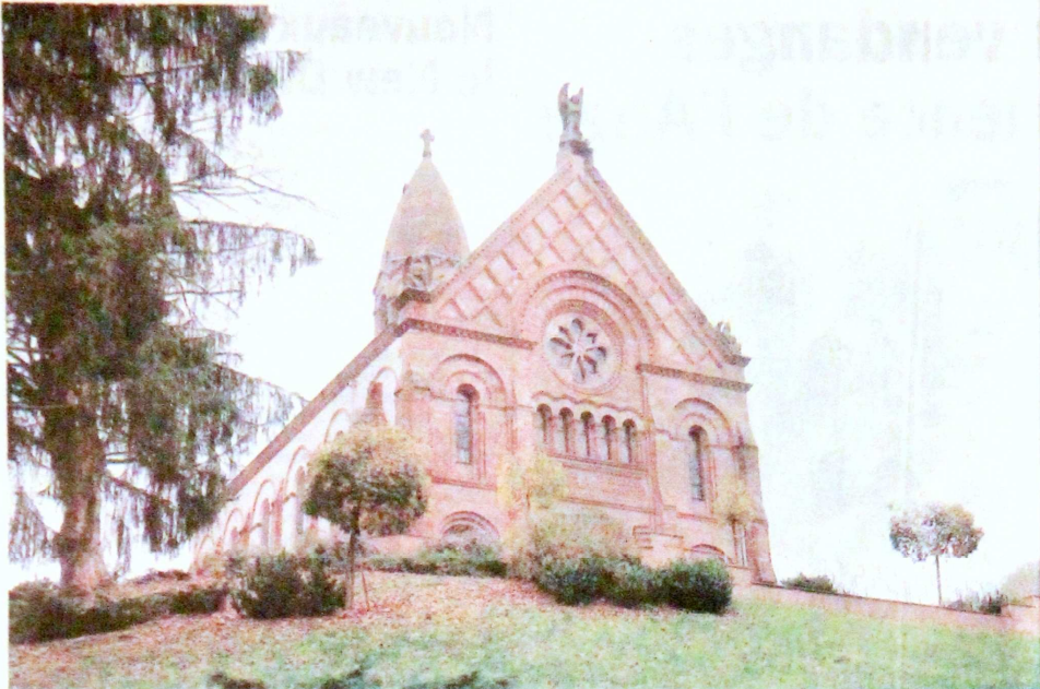
L'église de l'Emm a été consacrée le 4 octobre 1931 en présence notamment du général de Pouydraguin qui commanda en 1915 la 47 e division.