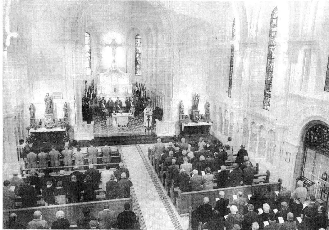
L'église de l'Emm a retrouvé sa vocation de mémorial de la première guerre mondiale en Alsace.

«Après avoir fait mémoire pendant la Toussaint, aujourd'hui faisons mémoire de ces vaillants soldats ainsi qu'à tous ceux qui viennent