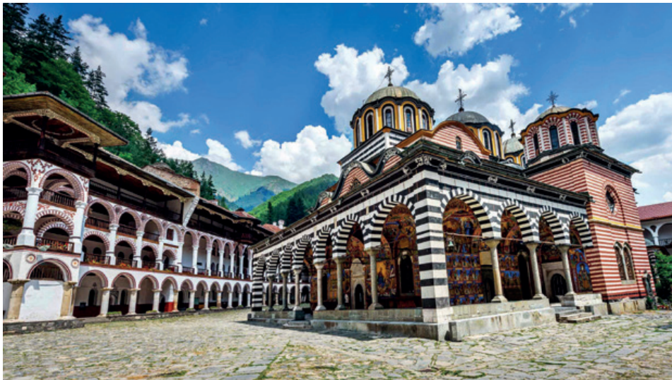
Le monastère de Rila en Bulgarie